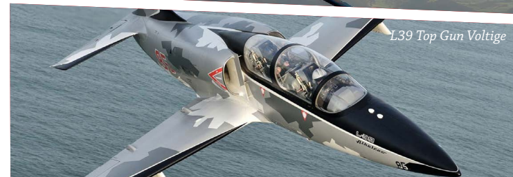
L39 Top Gun Voltige