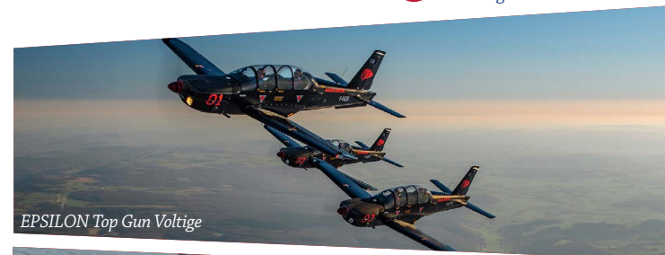
EPSILON Top Gun Voltige